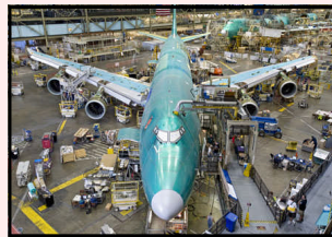
ボーイング社工場