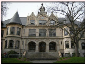
ワシントン大学(州立)Dennv Hall

アメリカ・シアトルにて全米有数の州立大学ワシントン大学と、ボーイング社工場、マイクロソフト社などを訪れます。