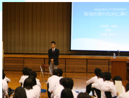
キャリア講演会(石岡第一病院医師)

キャリア講演会・職業観育成セミナー 大学模擬授業体験・進学講演会 学科・科目選択説明会 生徒や保護者との個別面談等