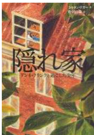
隠れ家 シャロン・ドガー著