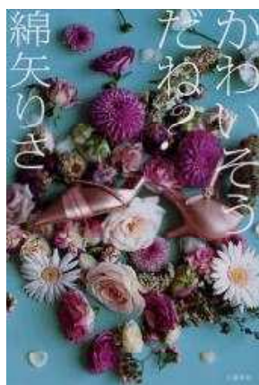
かわいそうだね？ 綿矢りさ著