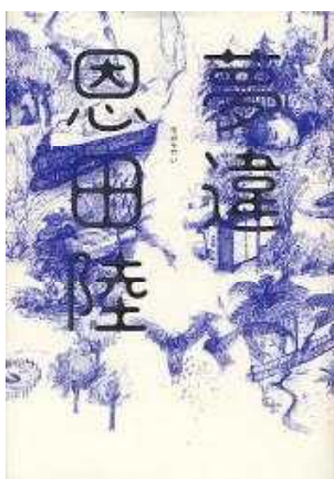
夢違い 恩田 陸著