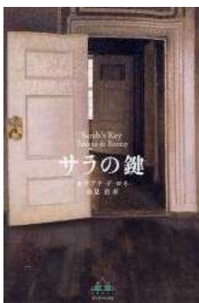
サラの鍵 タチアナ・ド・ロネ著